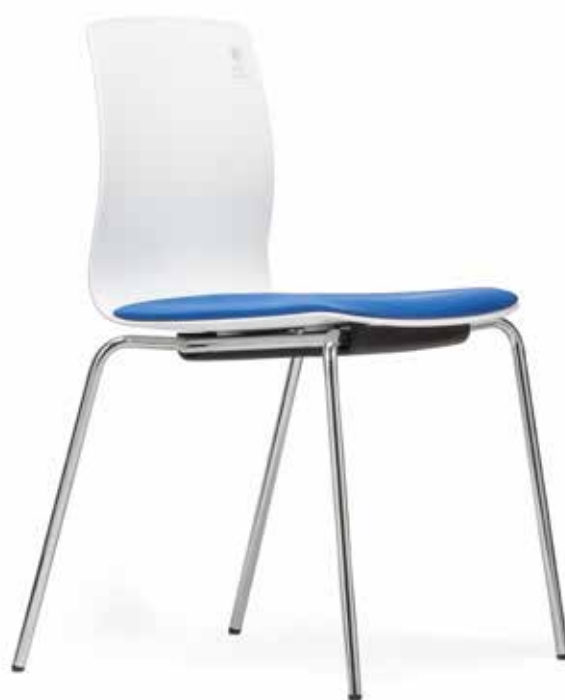
FI 7510_MCS Impilabile fino a 8 pezzi | Se puede apilar hasta 8 niveles