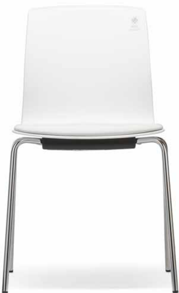
FI 7510_MCS Impilabile fino a 8 pezzi | Se puede apilar hasta 8 niveles

Protección invisible contra un enemigo invisible. La bandeja blanca de plástico lleva integrada un arma secreta muy valiosa, el tratamiento antimicrobacteriano MicroSilver BG™, que elimina las bacterias a través de la emisión continua de iones de plata. A petición, todos los modelos Fiore MicroSilver se pueden equipar con tapizados o revestimientos acolchados de cuero artificial Silvertex®, que también cuenta con un efecto antimicrobacteriano.