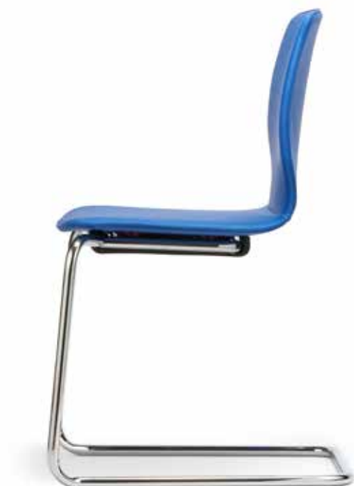
FI 7516_MCS Impilabile fino a 4 pezzi | Se puede apilar hasta 4 niveles