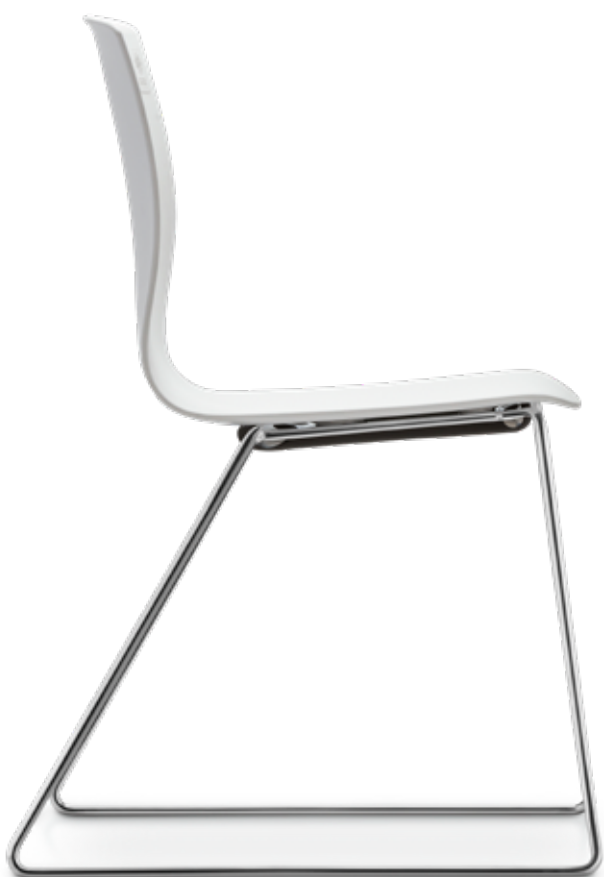
FI 7500_MCS Impilabile fino a 8 pezzi | Se puede apilar hasta 8 niveles