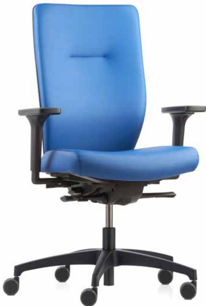
QS ST 6855 ES operator + braccioli | apoyabrazos A348KGS MicroSilver

Las sillas giratorias Stilo son unas compañeras de confianza para la oficina, ya que se adaptan a las necesidades particulares de cada persona. Los tapizados Silvertex® cuentan con un efecto antimicrobacteriano duradero y son fáciles de limpiar. Los suaves reposabrazos con equipamiento MicroSilver BG™ aumentan la protección frente a infecciones. La máxima higiene y comodidad en el puesto de trabajo quedan garantizadas.