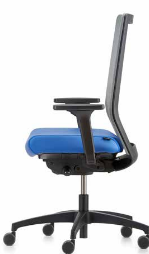
QS ST 6815 mesh + braccioli | apoyabrazos A348KGS MicroSilver